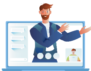
DEAF CAMPUS Azioni formative accessibili per le persone sorde